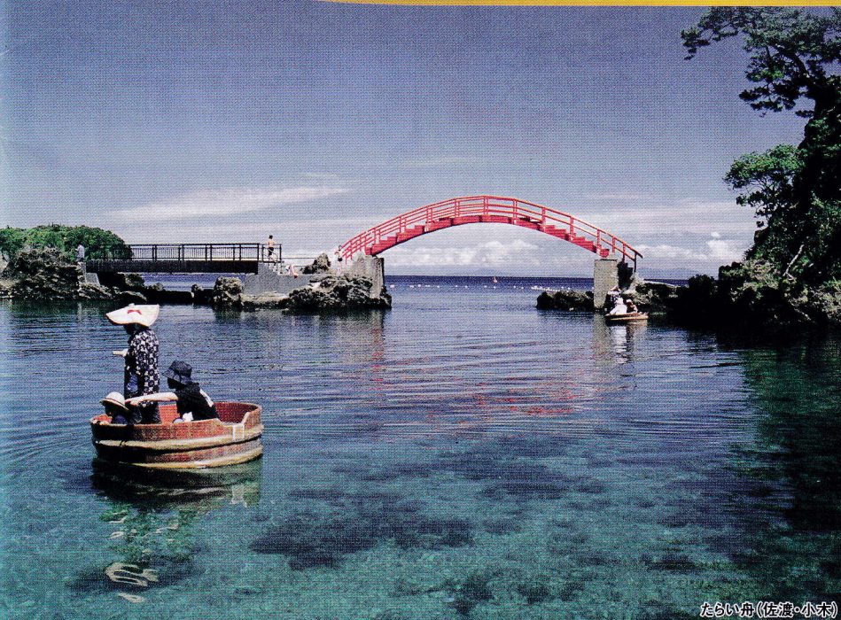
たらい舟(佐渡・小浜)