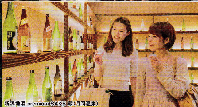
新潟地酒 premium SAKE 蔵(月岡温泉)