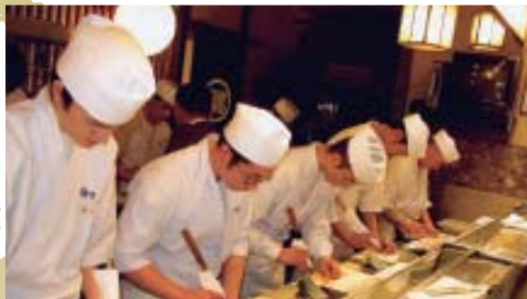
笹きり技術研修会