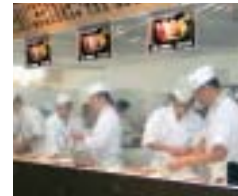
酒の陣、食の陣 握りの腕をみがくチャンス