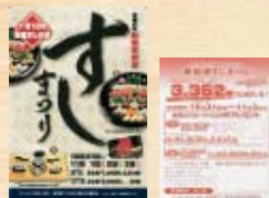
まつりポスターと応募ハガキ