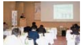
インターネット講習会