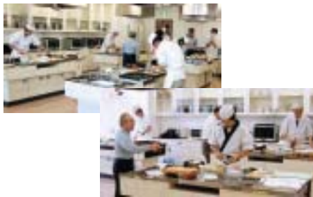
先輩たちの厳しい指導を受けた「すし技術研修会」の開催とその成果