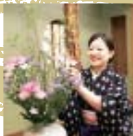
キレイなお花と笑顔でお客様をお迎え