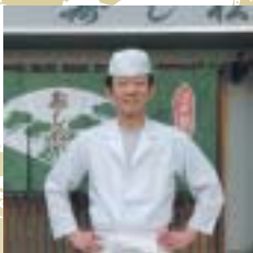
これからのすし業は、俺たちの手で…… by 寿し松 大岩青年部長